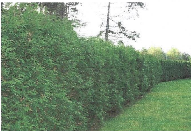
Eine Gartenhecke aus Koniferen oder gar Nadelgehölzen sollte spätestens bei Pächterwechsel entfernt werden, weil diese nicht mehr zulässig sind.

Der Vorstand des LSK wird ermächtigt, die Anlagen eigenständig zu ergänzen oder zu verändern, wenn die Notwendigkeit dazu besteht.